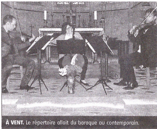
À VENT. Le répertoire allait du baroque au contemporain.

Le trio Joseph Hel s'est arrêté mercredi à Dry, le temps d'un concert donné en l'église.