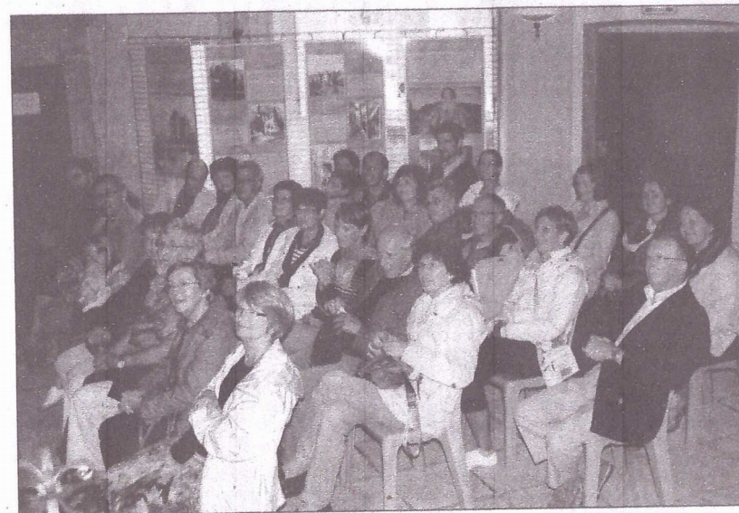
Le public a applaudi chaleureusement les concertistes.

Pratique : concert aujourd'hui, à partir de 15 à 18 heures. Entrée libre.