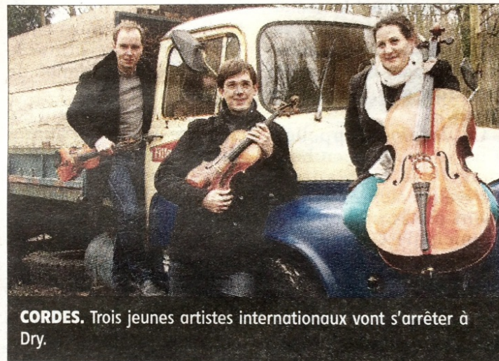
CORDES. Trois jeunes artistes internationaux vont s'arrêter à Dry.

Ils ont choisi une voie difficile, celle du trio à cordes, avec la volonté de redécouvrir le répertoire dédié à ce type de formations. Les trois musiciens sont issus de grandes écoles européennes, notamment du conservatoire de Paris. Ils se produisent au sein d'ensembles à rayonnement international :