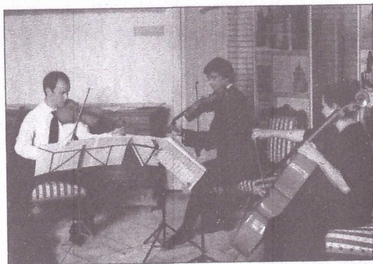
Beethoven, Mozart... Le trio (alto, violon et violoncelle) a joué de grandes œuvres dans différentes pièces du château.

Le trio proposait ce samedi trois concerts d'une trentaine de minutes chacun, invitant le public à le suivre dans différentes salles au rez-de-chaussée ou à l'étage du château. Chaque fois un salon et un compositeur différent, mais toujours une atmosphère d'alcôve intimiste, quelques